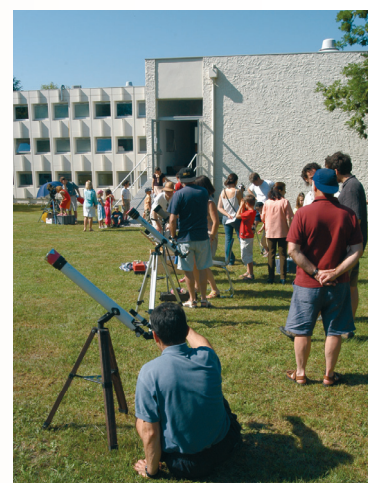
Observation de Vénus