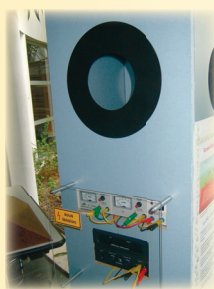
Tube de Crookes

Autour d'une chambre à brouillard qui permet de visualiser en direct le passage des particules, plusieurs expériences interactives ont été réalisées au LAPP pour montrer au public comment sont contrôlées ou détectées les particules. Une chambre à étincelles montre le passage des rayons cosmiques, un histogramme à billes illustre l'incertitude de mesure, un tube de Crookes montre comment contrôler des électrons, des expériences expliquent comment le noyau atomique fut détecté en 1911 ou comment se mesure la vitesse de la lumière, des chambres à fils et des matériaux scintillateurs ainsi qu'un programme de simulation montrent comment est identifiée une particule dans les détecteurs d'une expérience de physique des hautes énergies.