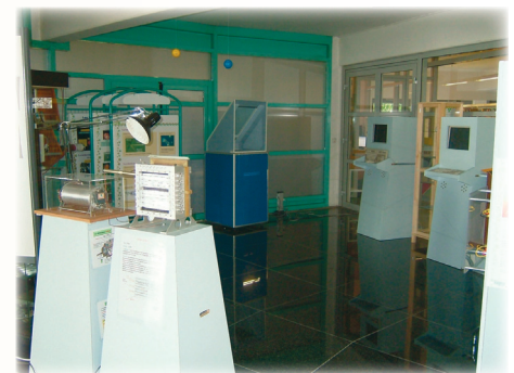
Chambre à fils, chambre à brouillard, bornes multimédias