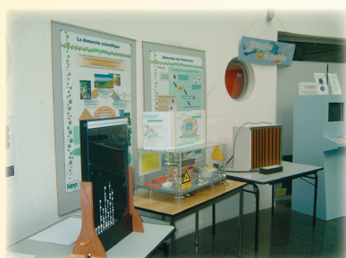
Histogramme à billes, cristaux CMS,